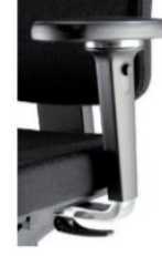
3D 360° alumiini