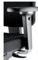
3D 360° alumiini