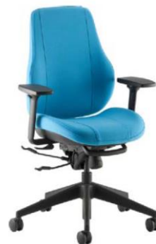
Step+ F23 + подлокотники