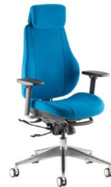
Step+ F24 + подлокотники