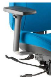
С вставками из алюминия