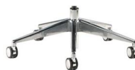
Из алюминия (опция из алюминия, окрашенного в черный цвет)