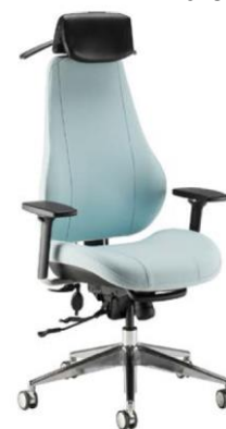
Step+ F37C + подлокотники + вешалка (C= поддержка поясницы)