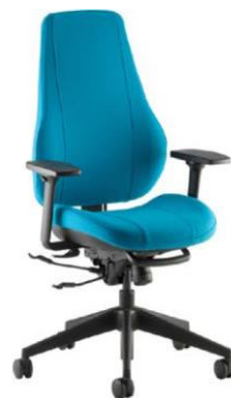
Step+ F26+ подлокотники