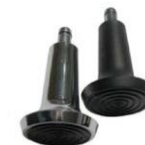
Кнопки; черные или из алюминия