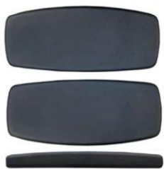
Ассиметричная форма, вид сверху и сбоку