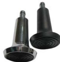
Glidfötter (svart eller aluminium)

Stolarna är utrustade med justerbara 3D 360° armstöd med två färgalternativ. Armstöden är justerbara i bredd (70 mm), i djup (60 mm) och i höjd (100 mm). Armstödens höjd från sitsen är 175-275 mm.