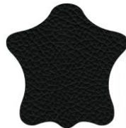
KAB Leather Black