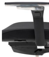
Idea XD ALU