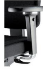
3D 360° ALU