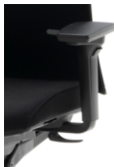
Idea soft 3D±20°